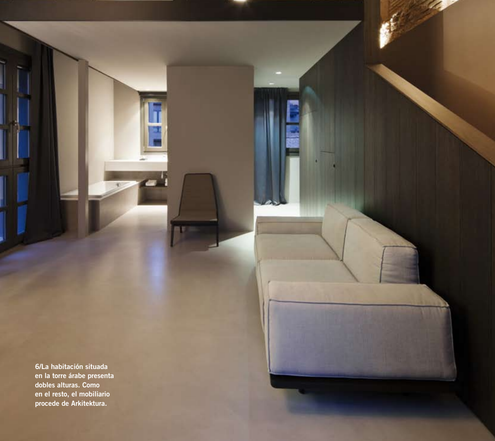
6/La habitación situada en la torre árabe presenta dobles alturas. Como en el resto, el mobiliario procede de Arkitektura.