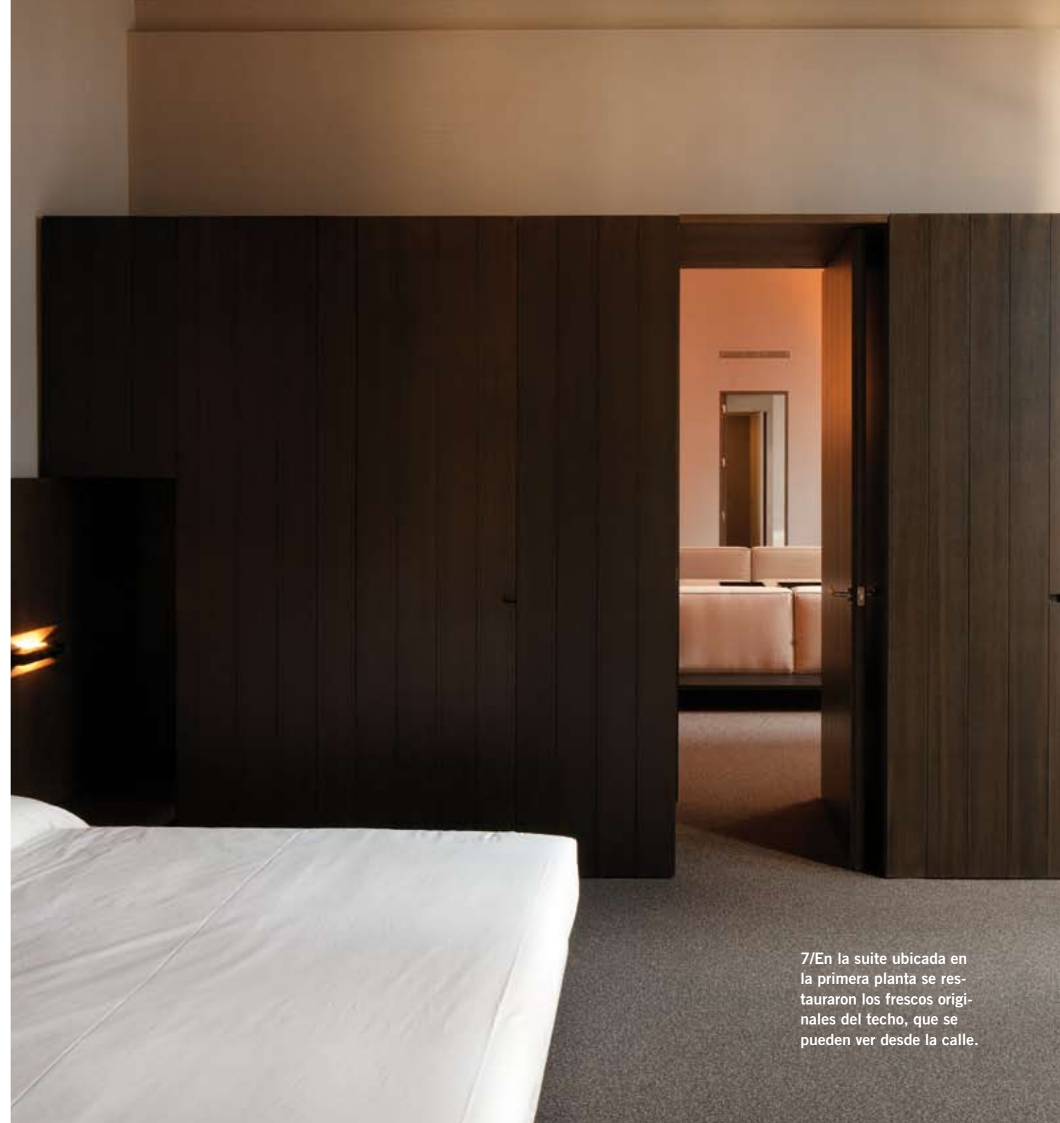
7/En la suite ubicada en la primera planta se restauraron los frescos originales del techo, que se pueden ver desde la calle.