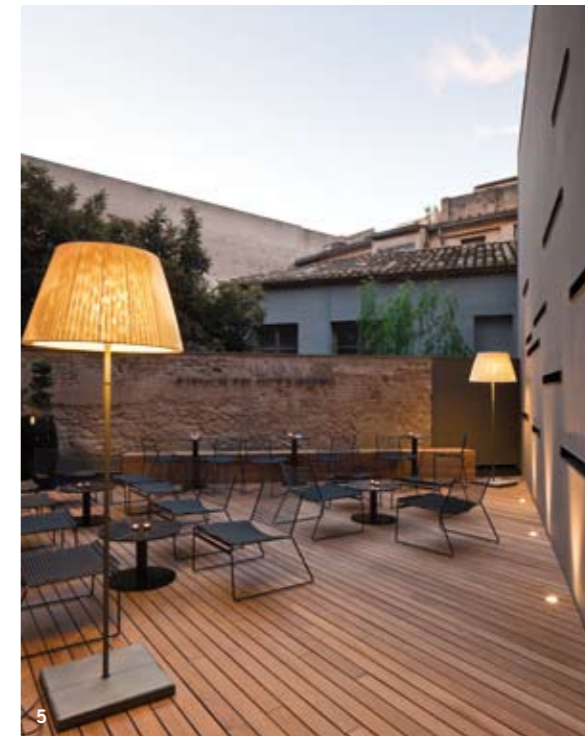
3 y 5/El Meta Bar, presidido por una barra de mármol, da acceso a la terraza a través de una puerta alistonada en madera negra. 4/La fachada, protegida, mantiene los elementos decorativos del XIX.

contrasta con un interior claro y luminoso. En la planta baja el lobby cobra protagonismo al organizar la circulación: hacia la recepción, integrada como una caja de luz dentro de la propia pared de obra vista original; hacia la escalinata situada al fondo, que conduce a las habitaciones y la biblioteca; al acceso al restaurante y finalmente, hacia su lado contrario, al bar y a la terraza. La sobriedad estética y formal del lobby como espacio articulador ha sido clave para integrar de forma armónica el resto de elementos, desde los estructurales al mobiliario. “La importancia de los elementos originales ha obligado a que nos hayamos inclinado por la utilización de materiales neutros, como suelos de resinas brillantes en colores muy claros, mármol arabescato para la barra del bar, y paredes de idéntico color que los pavimentos, buscando la máxima integración”, explica el autor.